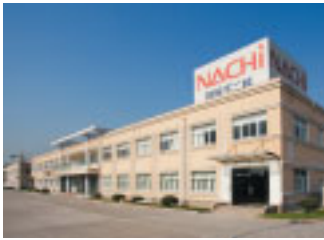
那智不二越(上海)贸易有限公司 上海不二越精密轴承有限公司 那智不二越(上海)精密工具有限公司