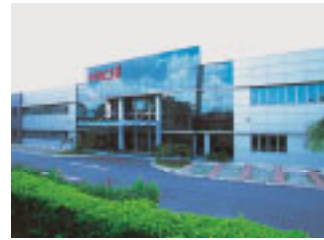
Nachi Singapore Pte. Ltd. Nachi Industries Pte. Ltd./新加坡