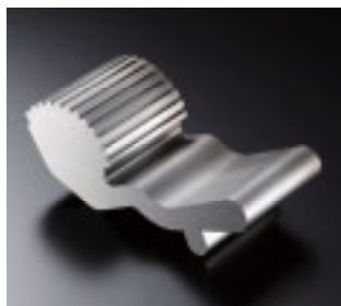
▲精密冲裁模具材料