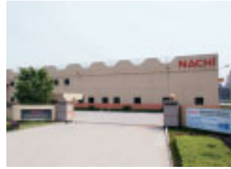
东莞建越精密轴承有限公司