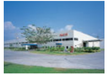
Nachi Technology (THAILAND) Co., Ltd./泰国