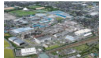
东富山事业所/日本