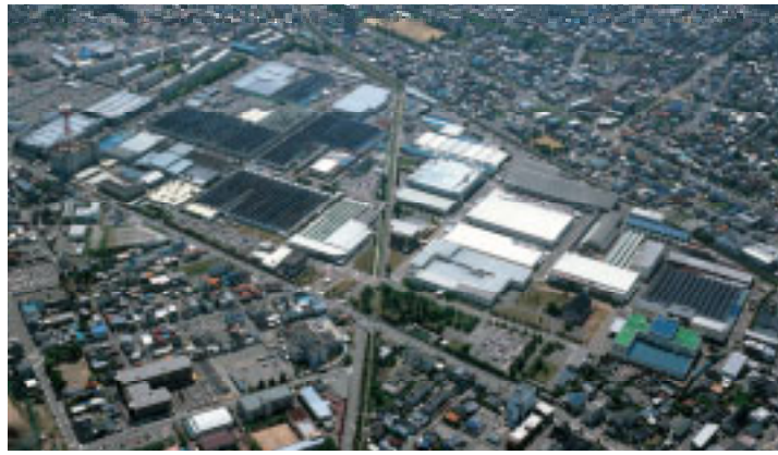
富山总公司, 工厂/日本