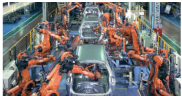
▲汽车车身厂的点焊工序