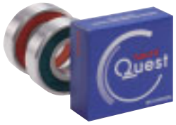
▲“Quest”滚珠丝杠支撑轴承

由于具有高速、高负载旋转条件下的长寿命、高精度、紧凑性等特点，NACHI轴承可提供安全性、可靠性和舒适性。