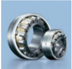
▲自动调心滚子轴承